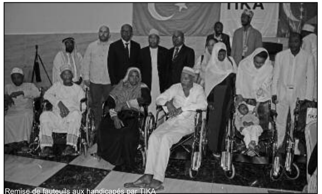
Remise de fauteuils aux handicapés par TIKA

Dar Zakat espère faire mieux pour cette catégorie sociale d'ici 2020 et demande le soutien de tous, maires et chefs de village, pour y arriver. Présents, le consul turc