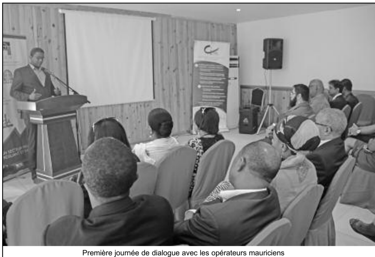
Première journée de dialogue avec les opérateurs mauriciens